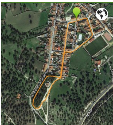
CIRCUITOS CATEGORÍAS BASE