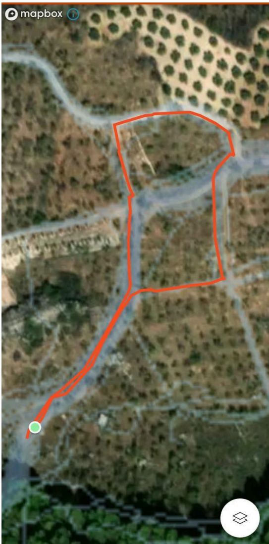
Circuito A (500 m.)