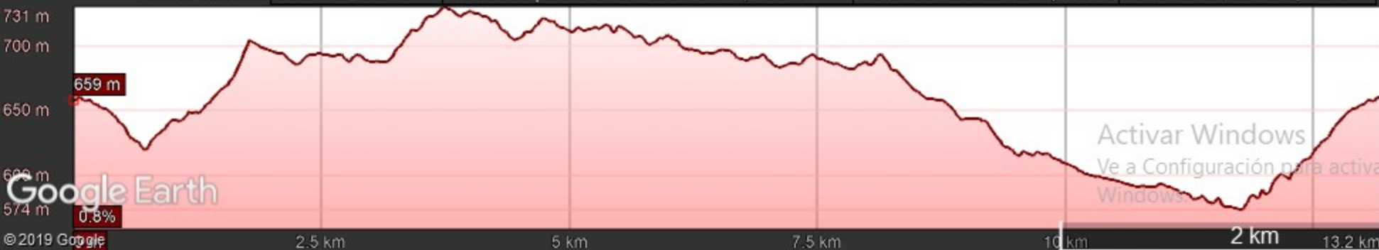
Gráfico: min., media, máx. Elevación: 574, 663, 731 m Total de intervalo: Distancia: 13.2 km Incremento/pérdida de elevación: 353 m, -352 m Pendiente máxima: 18.1%, -13.4% Pendiente media: 5.5%, -4.2%